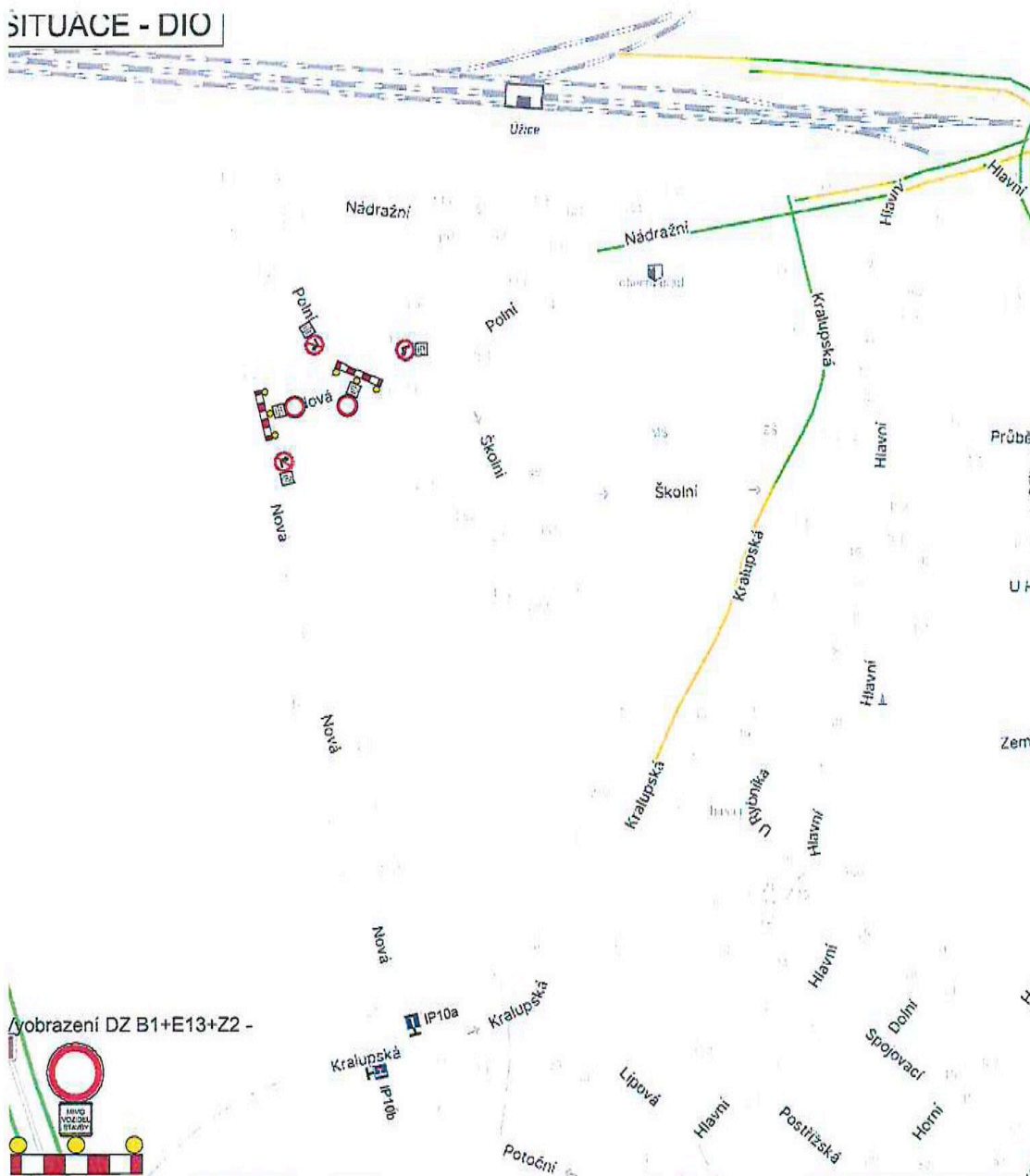
Vyobrazení DZ B1+E13+Z2 -